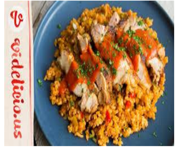
(写真はイメージです。)

も もの さんかくきん ふきん まい 持ち物 : エフロン・三角巾・布巾(2枚)